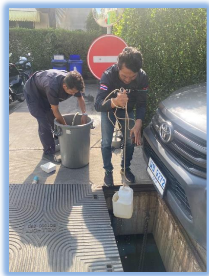
ภาพที่ 2-9 การบำรุงดูแลรักษาและตรวจสอบคุณภาพน้ำ